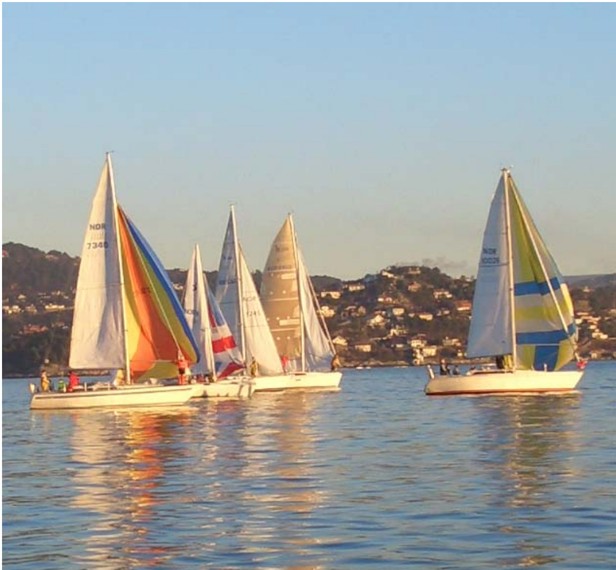
Neglesprett 2006, lite vind, men en fantastisk januar dag på sjøen.