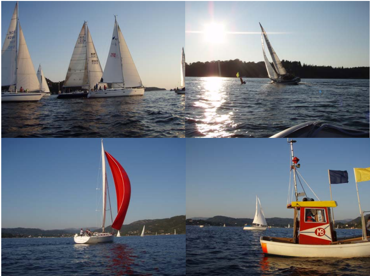
Mildetrimmen 21.august 2007