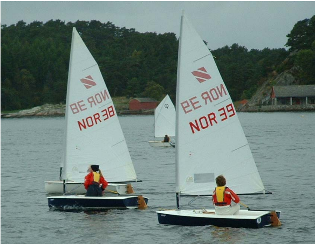
Zoom 8 på regattabanen i Fanafjorden