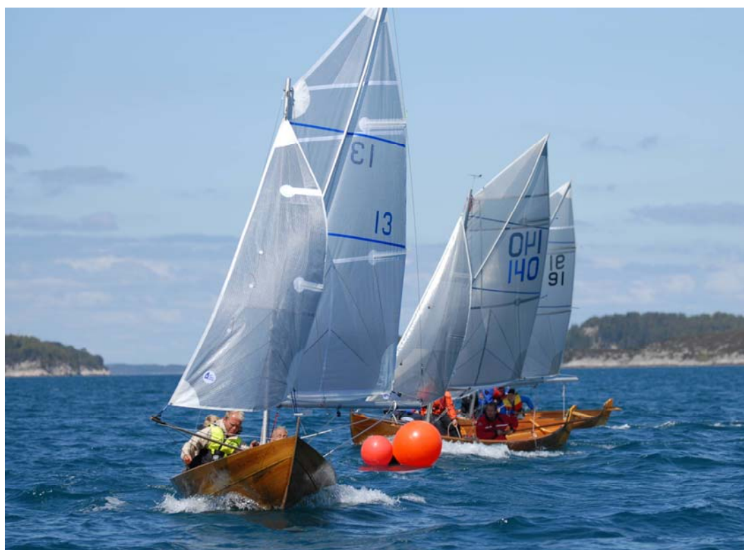
Fra Austevollregatta 2009, Hundvåkosen.