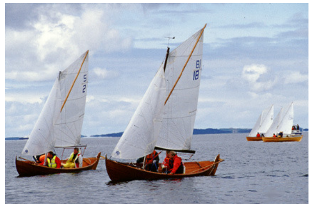
2 "Kryss" og 18 "Berserk" i tett og konsentrert kamp like etter start.