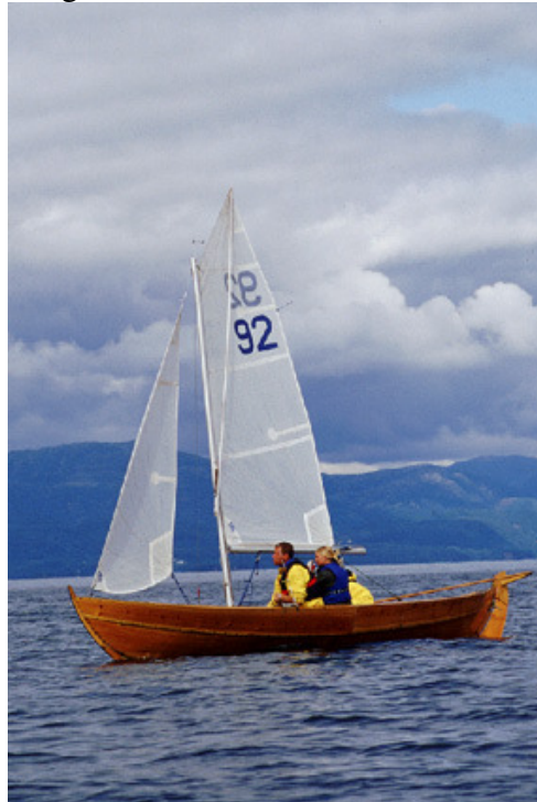
"Losen" Norgesmester 2001