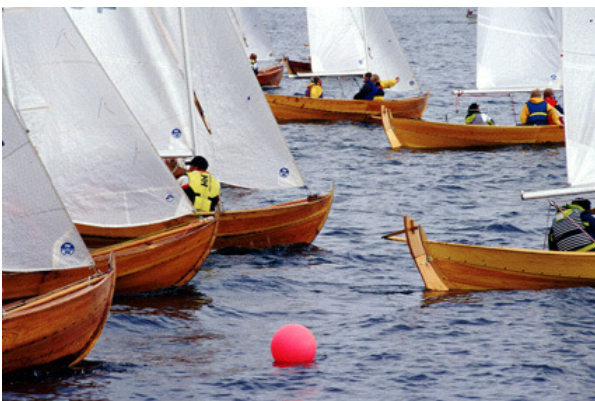
Det tetner til like før start.