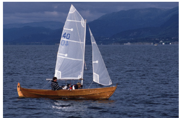
Beste jentebåt under NM : 40 "Blia"