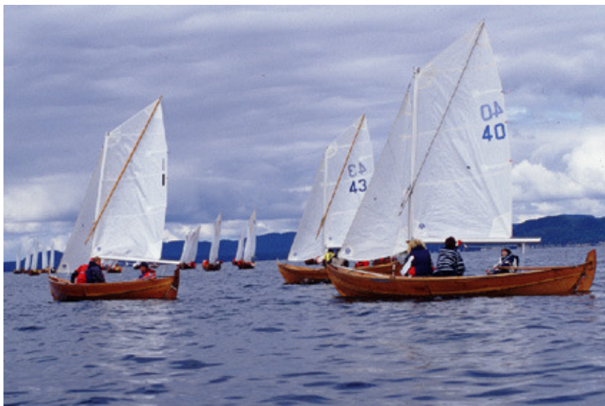
1 "Bambi" tar starten på 3.0 sek i 4. seilas under NM

DNC = Deltok ikke DNF = Fullførte ikke DSQ = Diskvalifisert OCS = På løpssiden av startlinjen da startsignalet ble gitt. Vendte ikke tilbake for å starte riktig. RDG = Godtgjørelse innvilget