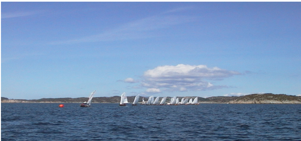
Like før start i søndagens første seilas under NM Oselvar 2003 på Møgsterfjorden i Austevoll