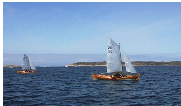
Norgesmester 20 "Terna" i søndagens første seilas

vesentlig høyere enn "Fant". Selv om "Fant" seilte fort foran i le klarte likevel "Terna" å komme først i mål, mens "Fant" sikret 2. plassen. "Losen" kom sterkt tilbake og tok 3. plass, men så lenge "Terna" var foran i mål, var det den som tok hjem sammenlagtseieren.