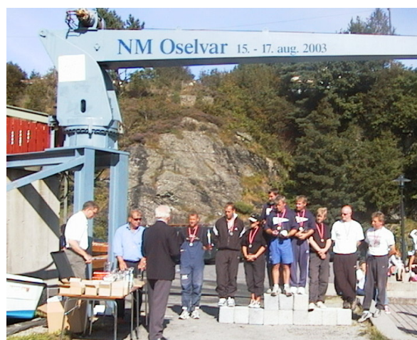
Medaljevinnerne samlet på seierspallen