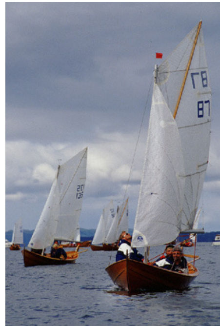
87 "Benito", seilt av Terje van der Meeren, fikk napp i Oselvarklubbens Rankingpokal i Spriseilklassen for 2003 med oppnådde 368 poeng

Resultater for rankingpokalene for 2003 finnes på side 15 og 16.