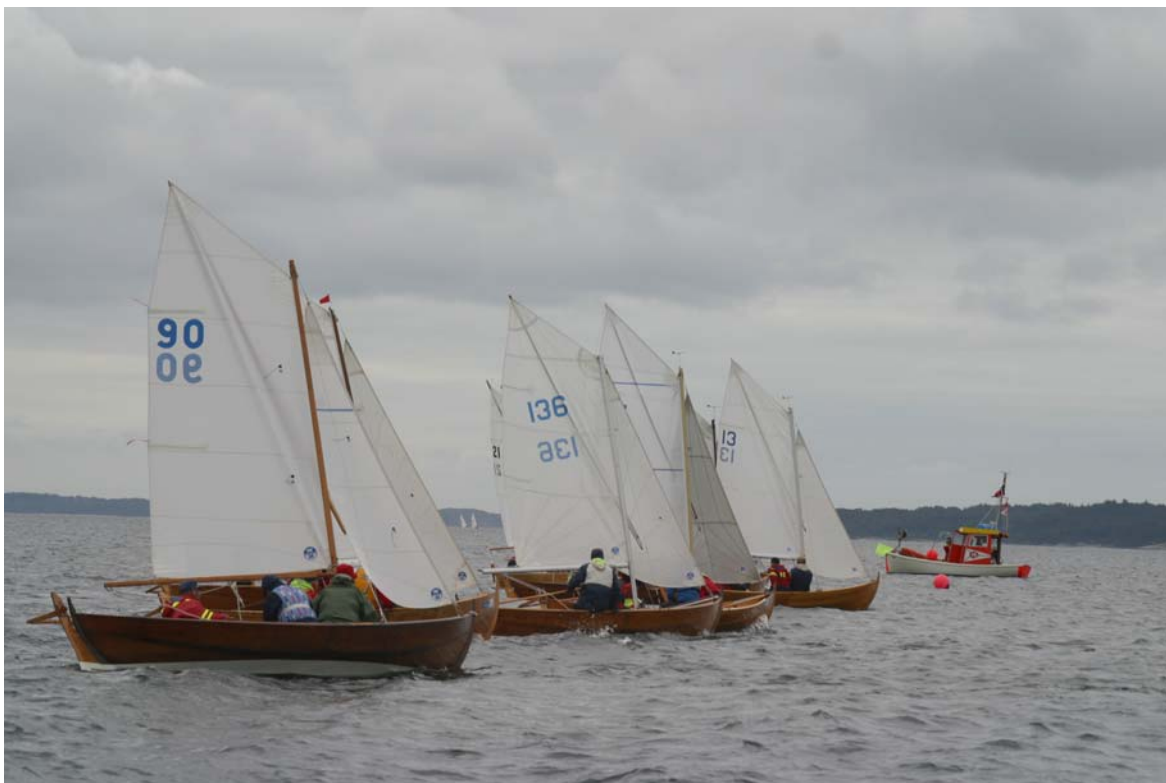
Starten går i 4. NM-seilas.

Dessverre deltok bare 14 spriseilere i NM, slik at oselvarklassen tapte sitt NM status for 2006. Det må derfor seiles nasjonalt klassesesterskap i 2006 med minst 20 deltagende båter for at klassen skal få tilbake gyldig NM status for 2007.