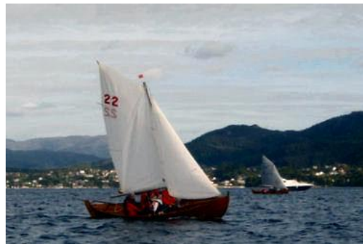
Vinner av MB's Oselvartrimmen 2008: 22 "Fant".

I Milde Båtlag har onsdagskvelder i juni og august vært benyttet til treningsseilaser for oselvere. Serien, som kalles Oselvartrimmen , hadde start og innkomst ved Mildeskjæret. I alt ble det avviklet 5 treningsseilaser i spriseilklassen. Resultater på side 18.