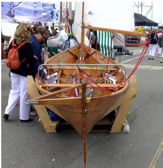
"Ola Dilt" fullt rigget på stand i Brest beundres av interesserte besøkende under festivalen.

Alle dei norske båtane vart defilert i den indre hamna før dei segla i lag med fleire hundre andre skip og båtar i den ytre hamna. Då kveldsmørket kom var det formasjonsseglas med nærare hundre skip som vart opplyst av lyskastarar. Ein spektakulær måte å visa fram kystkultur på som mange arrangørar kunne henta inspirasjon frå.