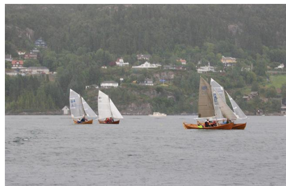
Båtene lenser mot mål i siste seilas.

Før den 5. og siste seilasen ble banen trukket mer mot Brandaneset på nordvestsiden av Fanafjorden for å komme vekk fra den verste vindskyggen under Fanafjellet. Pølsebanen ble lagt mot en vindretning fra NØ. Men vinden dreide mot øst, så kryssmerket måtte flyttes østover før båtene skulle begynne på 2. krysslegg.