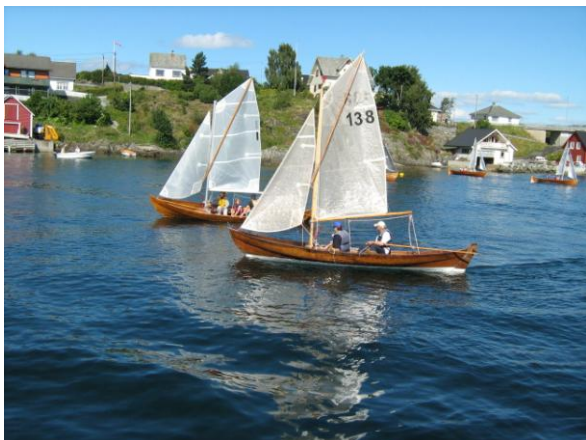
1 "Bambi" og 138 "Sjur" ved Vedholmen før start.

Oselvarseilassen ved Vedholmen er en "sjarmørseilas" hvor det viktige er å vise frem den seilende oselvaren for et større publikum. Med mellom 100 og 200 besøkende under det totale arrangementet, var det godt med tilskuere til å biva seilasene.