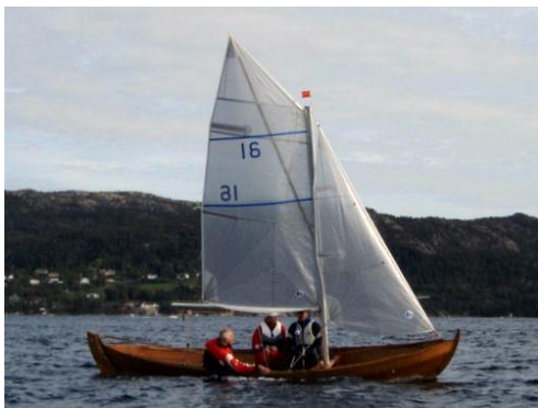
MB klubbmester 2008: 16 "Stegg".