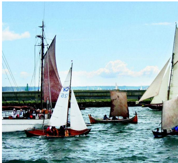
K 25 "Ola Dilt" på havnen i Brest på den norske dagen. Det var tett mellom farkostene. En nordlandsbåt for fulle seil er også med på å sette farge på evenementet.