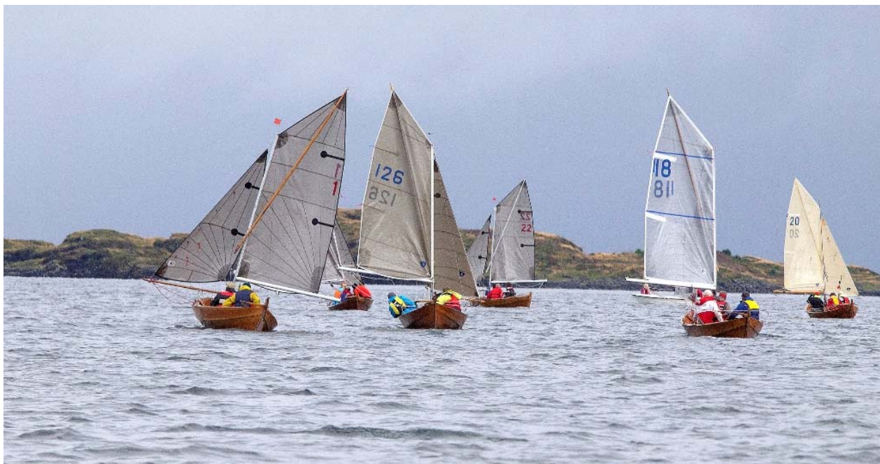
Fra Norgesmesterskap 2019 Oselvar på Tysnes.