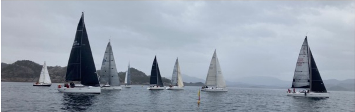
Korsfjordtrimmen 9. mai 2023.

som deltok på Korsfjordtrimmen i 2023. Fra resultatene på Korsfjordtrimmen kan en nevne at fra MB ble Gullango nr 2 i NOR-rating tom 0,940, Miramis nr 2 i NOR-rating 0,941-1,009, og Madcap nr 8 i NOR-rating fom 1,010.