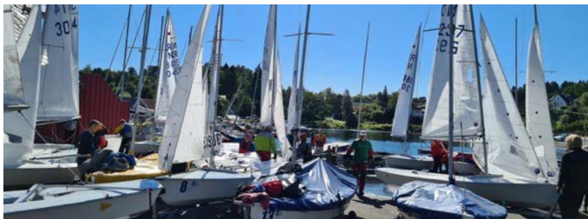
Klargjøring av Snipene.