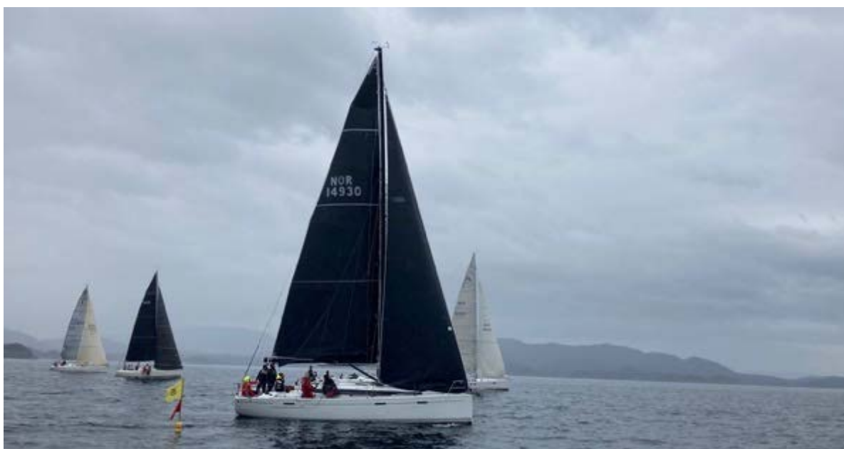
Korsfjordtrimmen 9. mai 2023