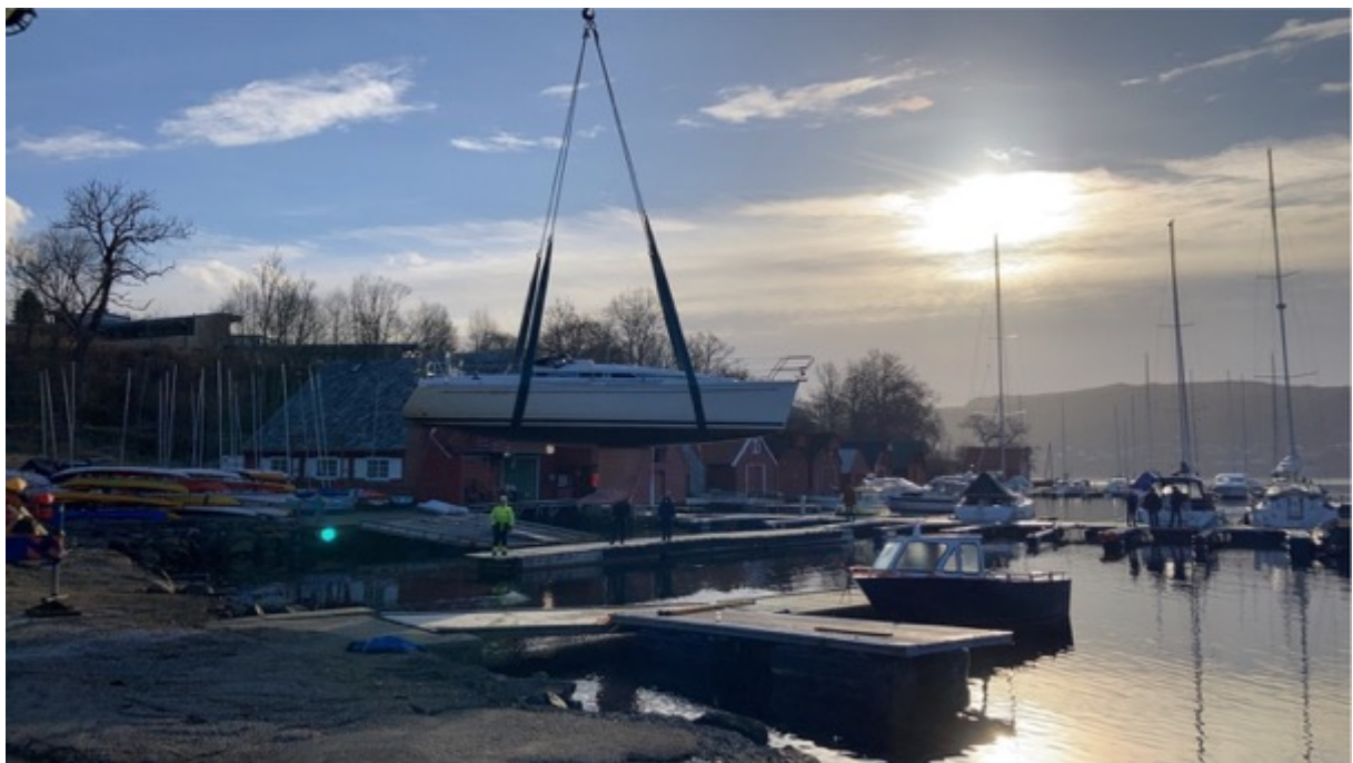
Båtutsett i Mildevågen.